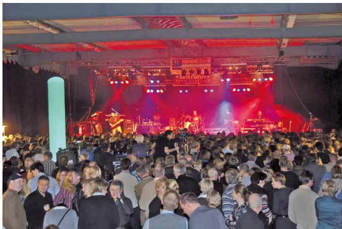
Große Resonanz hatte das Benefit-Konzert beim letzten Mal

Unser Nachwuchs ist unsere Zukunft. Nur starke und selbstbewusste Kinder können diese später auch positiv beeinflussen. Aber nicht alle Kinder wachsen in einem unbeschwertem Umfeld auf. Förderung von außen in Form von gemeinnützigen Organisationen ist hier also besonders wichtig.