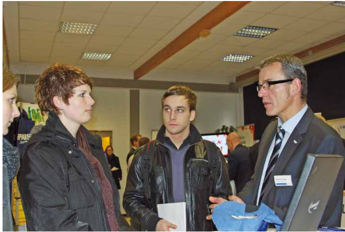
Direkten Kontakt zwischen Unternehmer und Student gibt es auf der Kontaktmesse.

Nach zwei erfolgreichen Messen in den Jahren 2009 und 2010 können sich Unternehmen auch in diesem Jahr als zukünftige Arbeitgeber, sei es für ein Praktikum, eine Abschlussarbeit oder die erste Festanstellung, positionieren. Besonders im Hinblick auf die immer wieder aufkommende Diskussion um den Fachkräftemangel in verschiedenen