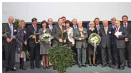
Preisträger und Laudatoren des zweiten emsländischen Unternehmenspreises