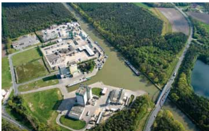
Eine positive Entwicklung kann der interkommunale Hafen Spelle-Venhaus aufweisen.

„Die emsländische Wirtschaft ist gut aus der Krise herausgekommen. Ich behaupt-